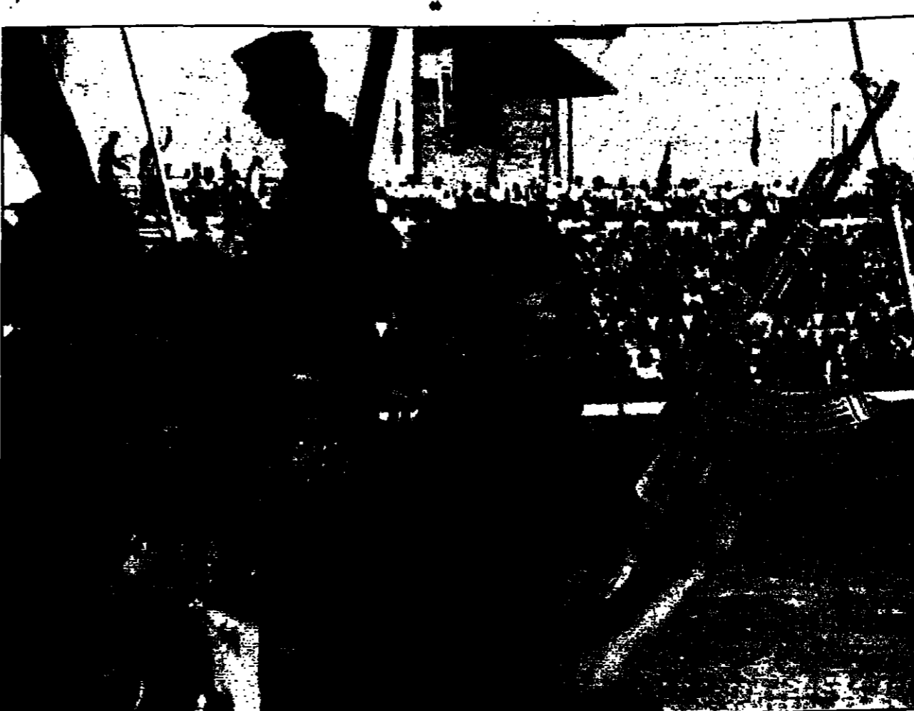
جنود عراقيون يشاركون باسئمتهم في احتفالات يوم بغداد